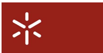
Universidade do Minho