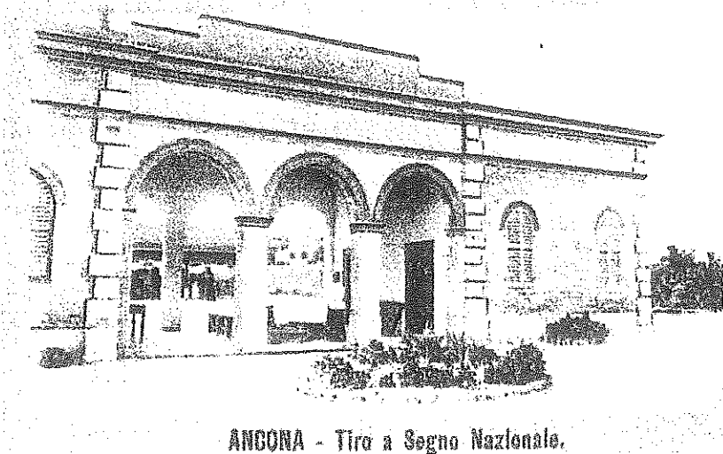
ANCONA - Tiro a Segno Nazionale.

Lo Stadio Dorico fu costruito nel 1931 lungo Viale della Vittoria, sul sito del precedente impianto del Tiro a Segno Nazionale di cui conserva, debitamente rielaborato, l'avancorpo dell'ingresso ottocentesco. Infatti la sezione Tiro a Segno di Ancona fu tra le prime ad essere istituite nelle Marche e in Italia, proprio nel giugno 1862.